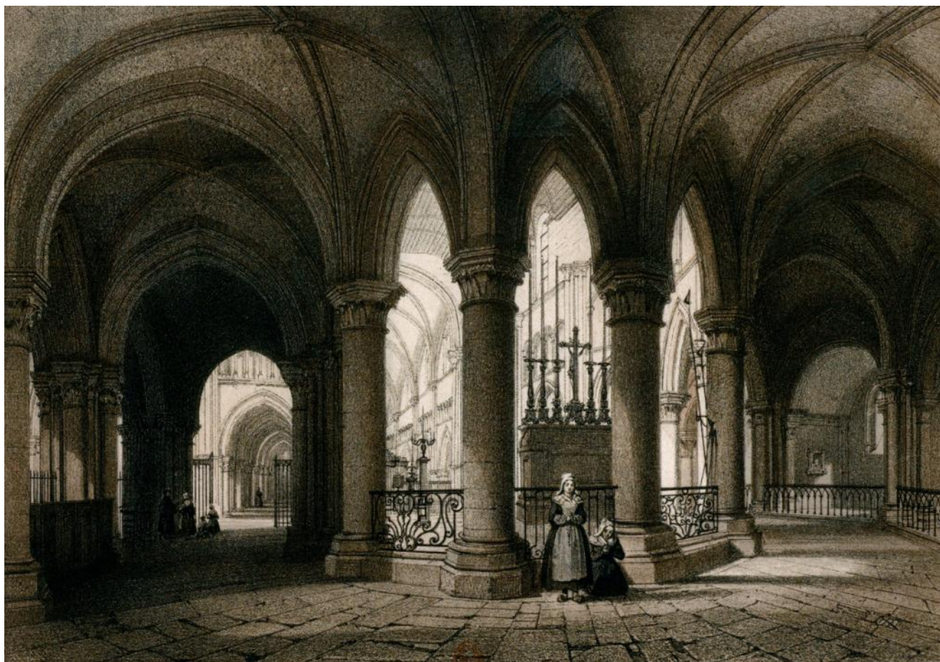
Eglise Saint-Pierre, vue prise derrière le chœur

Au XVI e siècle, l'ensemble reçut des chapelles circulaires entre les colonnes des collatéraux. Au-delà de la ferveur religieuse, certaines traduisent les activités essentielles d'un chef-lieu à la santé économique retrouvée après la guerre de cent ans et les aléas de la Réforme.